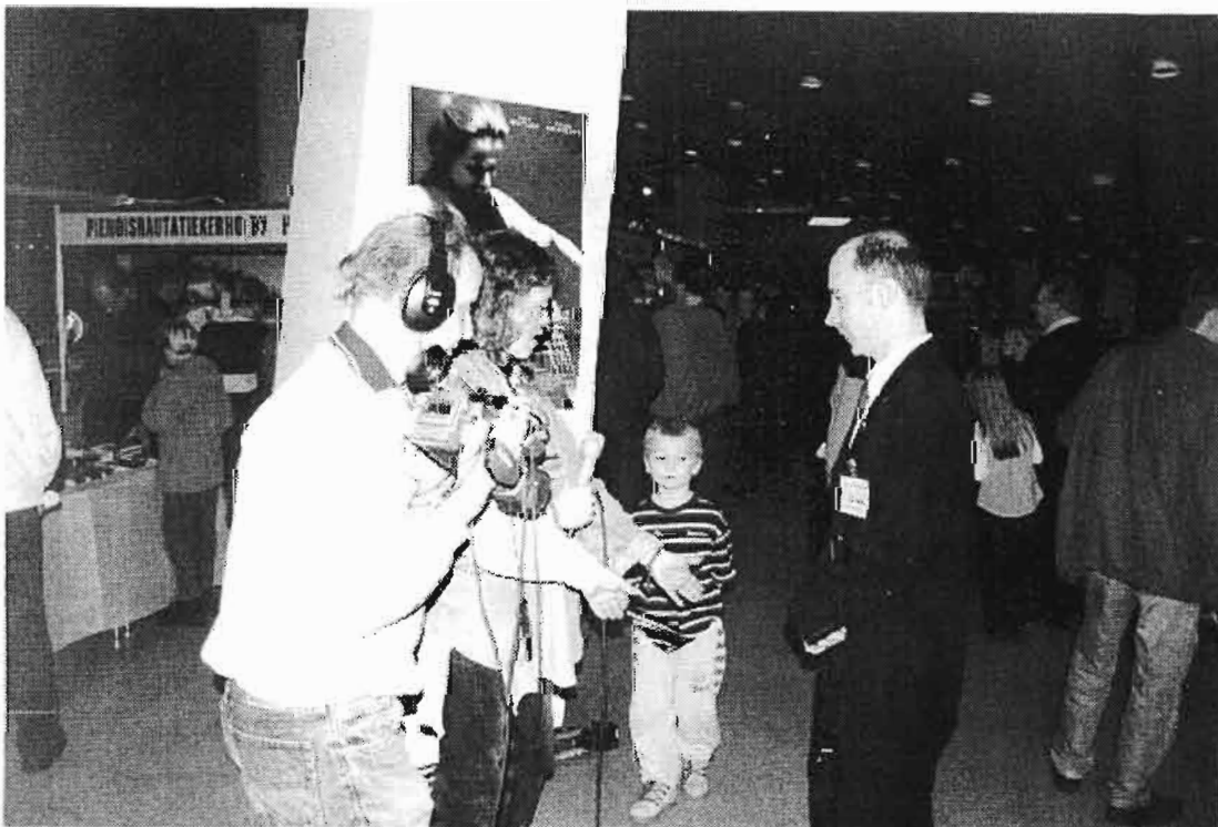
Myös tiedotusvälineet huomioivat näyttelyn kiitettävästi.