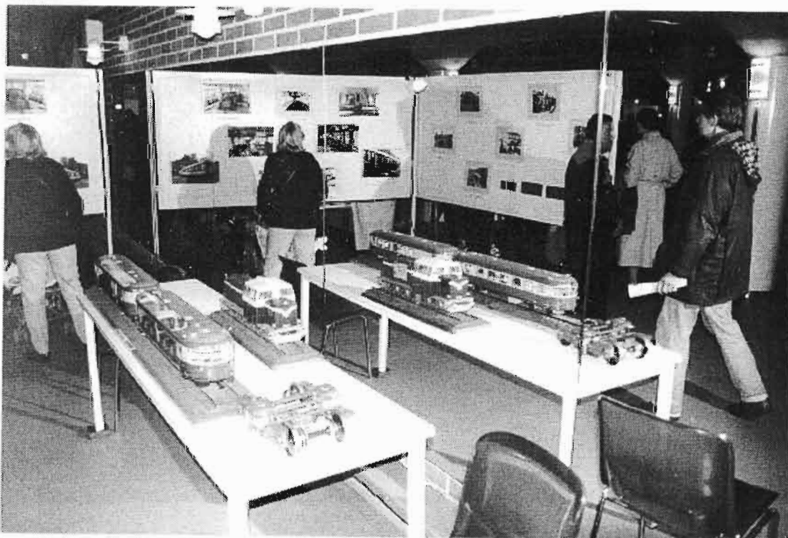
VR Turun Konepajan hienot pienoismallit olisi moni poika halunnut kotiinsakin.