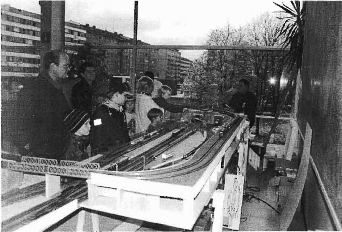
Alppirautatieharrastajat saivat kerrankin tuoda ratansa kukkulan huipulle. Kuvasta näkyy hyvin Konserttitalon ilmavuus.