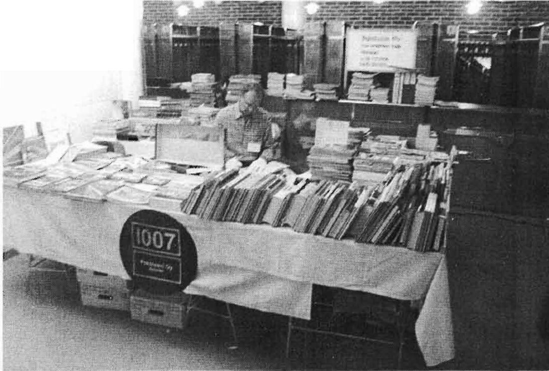
Pokstaavin osastolla oli rautatieaiheista kirjallisuutta kilokaupalla.