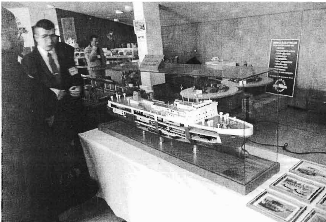
Railship on aina Railship.