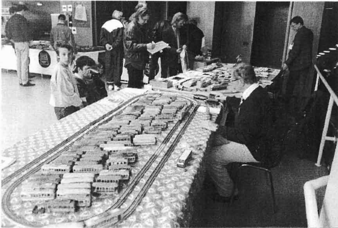
Monet vanhat rouvat ja herrat olivat tulleet muistelemaan raitiovaunujen kulta-aikaa joko lastenlasten kera tai ilman niitä.